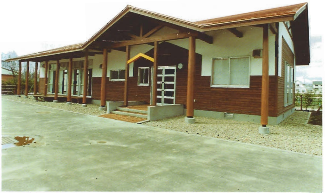
県営住宅桜団地集会場