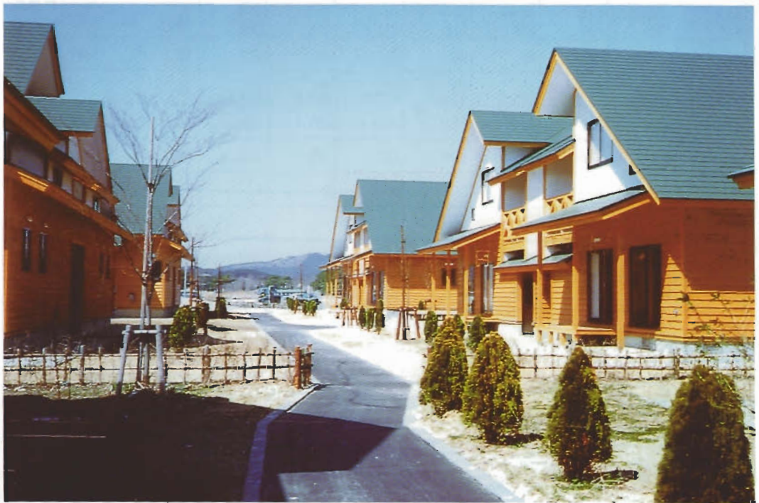
県営住宅船越内子団地