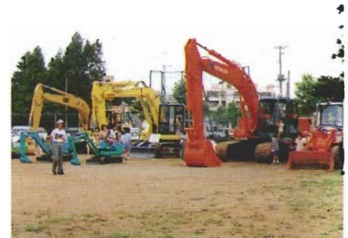
ランドアート（建設業の役割や仕事を広く県民にアピールし、業界のイメージアップを目的としたイベント）