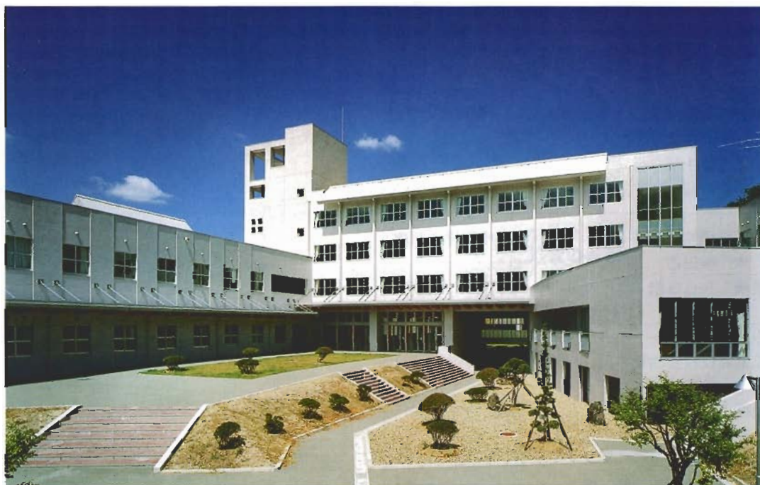
秋田県立城南高等学校