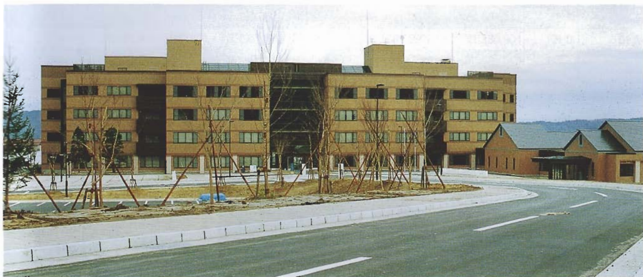
秋田県立農業試験場附属栽培施設