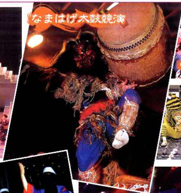
なまはげ太鼓競演